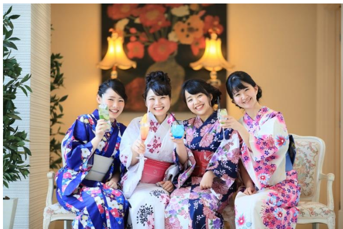
館内にもフオトスポットが満載