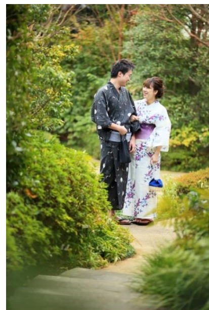
浴衣での庭園散策も可能