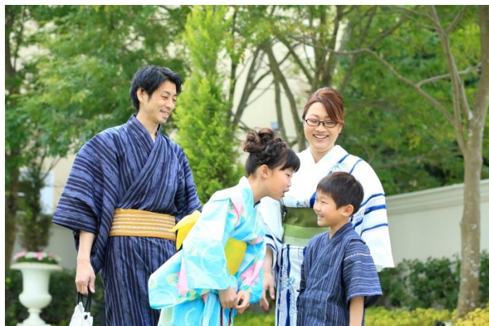
ファミリーでの記念写真にも(浴衣レンタルは大人用のみとなります)