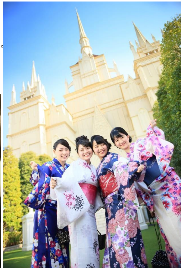
大聖堂前での撮影イメージ